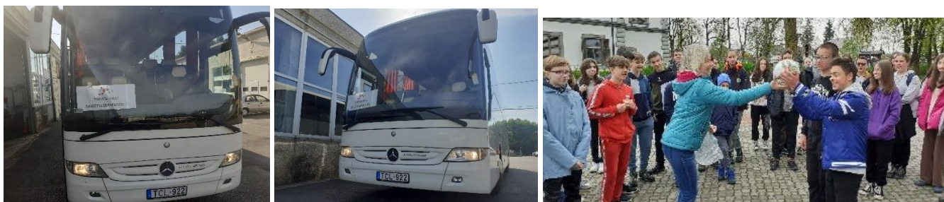
Nyilvános megjelenés: Szigetszentmiklós Önkormányzatának lapja 2023.8. szám